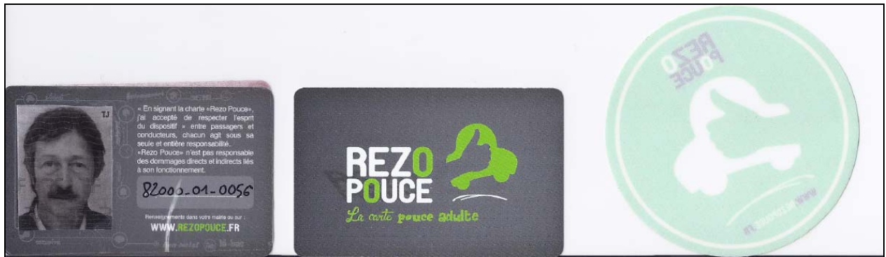
Figure 3 – Carte d’adhérent et macaron autocollant