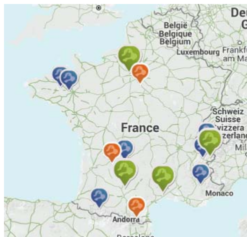
Figure 2 – Essaimage en cours ou en projet au début 2016

La Figure 2 présente les réseaux créés (vert), en voie de création (orange) et à l'étude (bleu) au début de 2016.