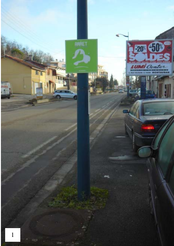
Figure 5 – Exemples d'arrêts sur le pouce