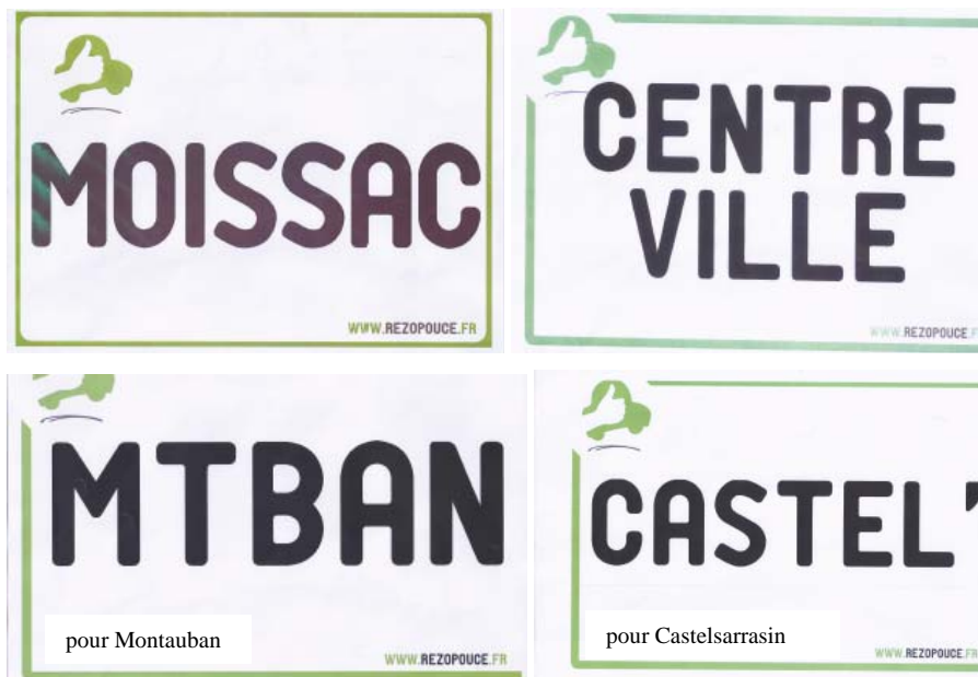
Figure 4 – Exemples de fiches de destination

Les fiches sont au format A4 et rangées dans une pochette plastifiée